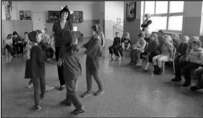
Návštevy predškôlakov sa už stali dobrou tradíciou.

Pravidelným podujatím spolupráce ZŠ Komenského a MŠ na Jarnej a Obchodnej ulici bol aj v tomto školskom roku projekt pod názvom „Škôlka v škole“. K predškólakom zo spomínaných MŠ pribudli aj predškôláci z Dargova.