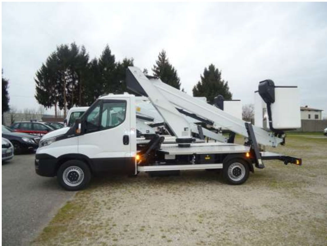
Ilustrační foto-plošina PT160 - plošina má velmi malé transportními rozměry.

Pozor: veškeré vedení hydraulických hadic i kabelů včetně hydraulického válce je uvnitř ramen , což zabraňuje jakémukoliv poškození nebo opotřebení. Velkou výhodou této plošiny jsou malé transportní rozměry .