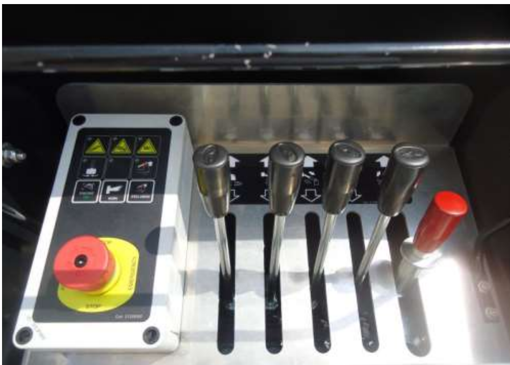
Obr. ovládání v pracovní kleci - proporcionální hydraulický ovladač umožňuje více pohybů plošiny najednou a zaručuje plynulost pohybů ramen.

INREKA PLOŠINY SERVIS, s.r.o. se sídlem U Korečnice 1768, 688 01 Uherský Brod, společnost zapsána v OR vedeného Krajským soudem v Brně oddíl C, vložka 46132, IČO:26933195, DIČ:CZ26933195, bank.spoj.:KB Uherský Brod, č.úctu: 35-1314220297/0100 Tel.:+420 571896555, fax:++420571896556, e-mail: inrekaservis@email.cz