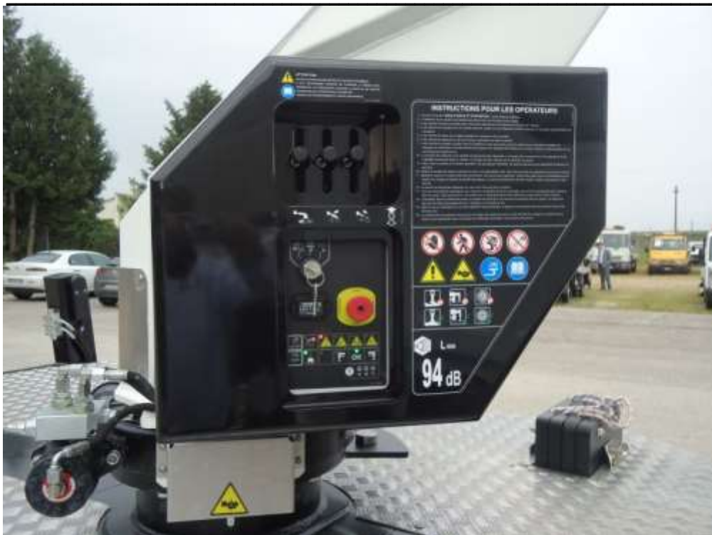
Obr. ovládání na spodním stanovišti a držák se stabilizačními podložkami.